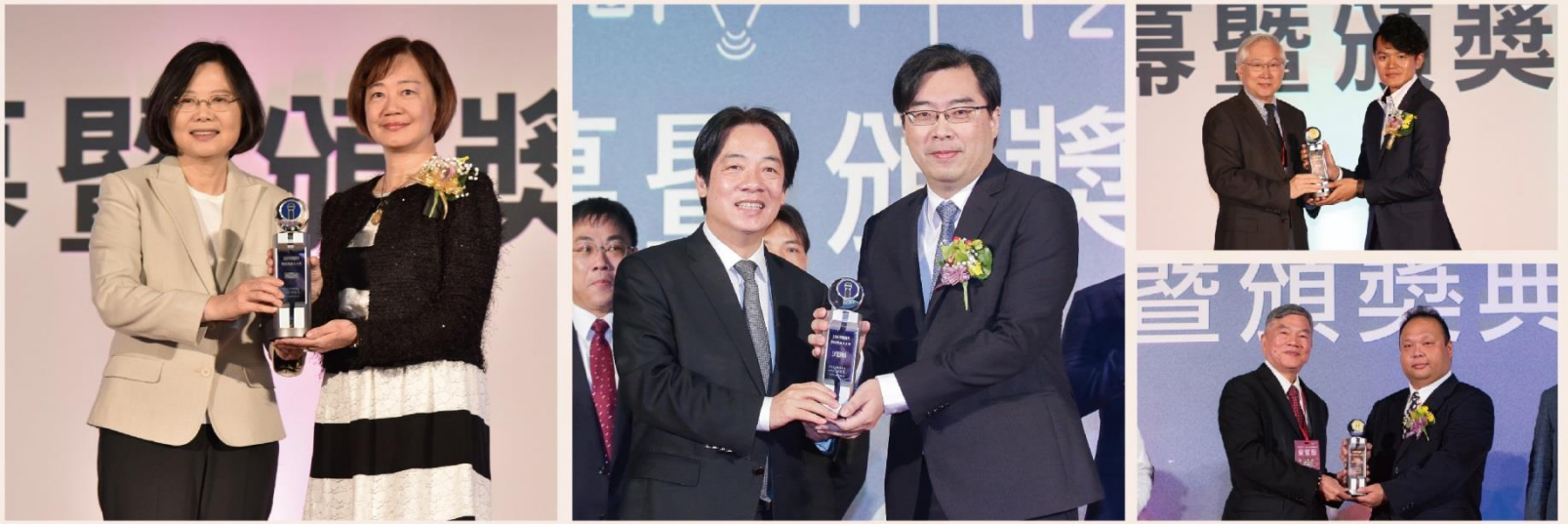
歷年政府首長蒞臨頒獎・授予至高榮耀