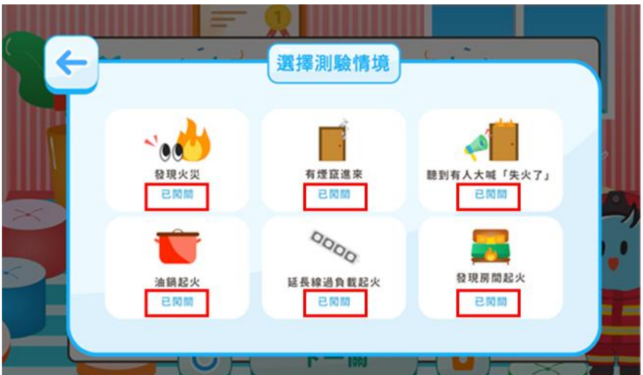
圖 2-互動式防災常識教學程式(火災應變要領)完成闖關截圖