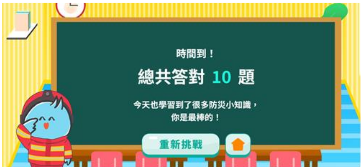
圖 4-防災常識快問快答挑戰 1 分鐘答對 10 題截圖