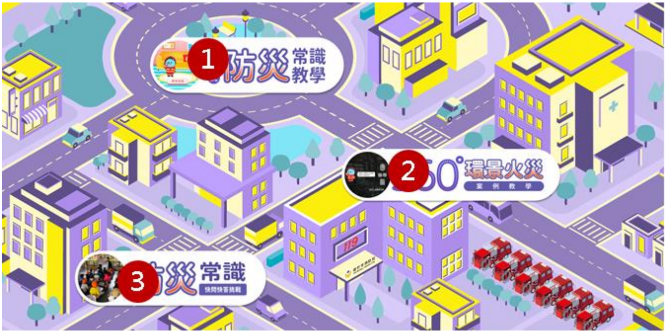
圖 1-本局開發 3 組互動式防災教學程式